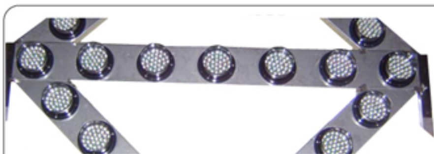
사진 & 도면