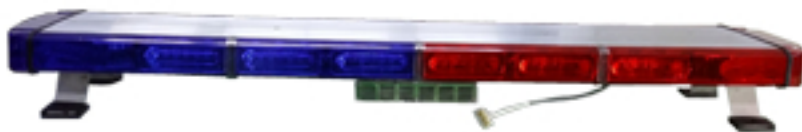
사진 & 도면