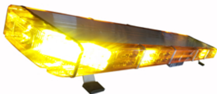
사진 & 도면