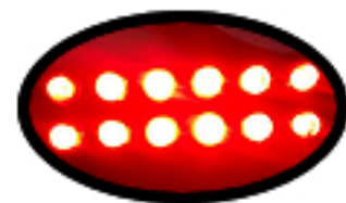
● 고휘도 LED 특수렌즈와 반사경 모습을 순간 촬영한