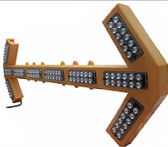
사진 & 도면