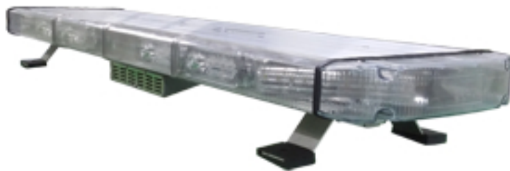
사진 & 도면