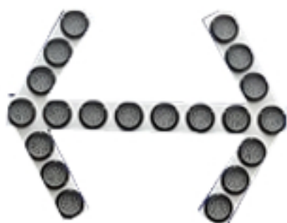
사진 & 도면