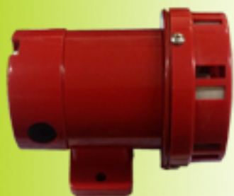
소형 모터 싸이렌