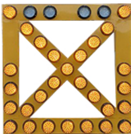
사진 & 도면