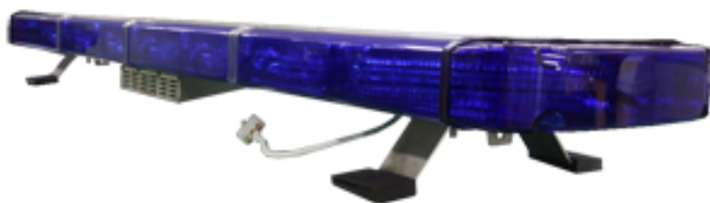
사진 & 도면