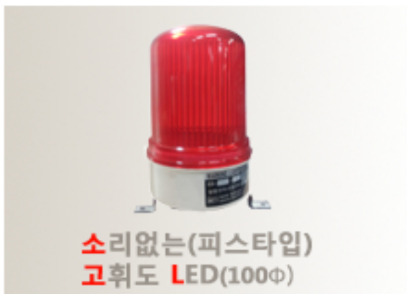
소리없는(피스타입) 고휘도 LED(100Φ)