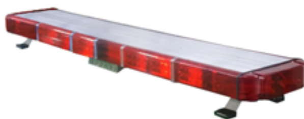
사진 & 도면