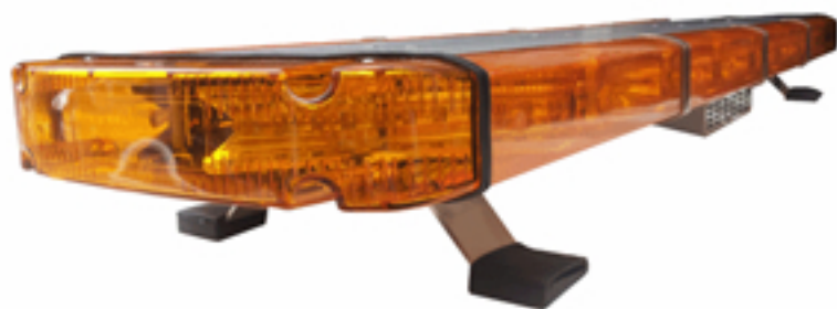
사진 & 도면