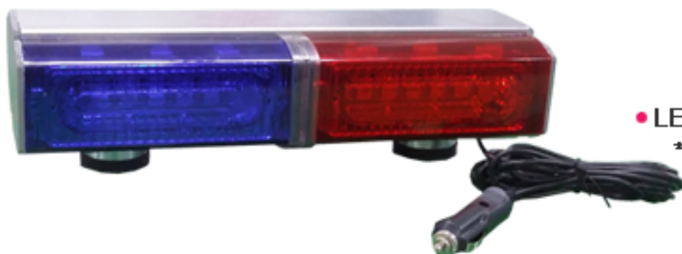
사진 & 도면