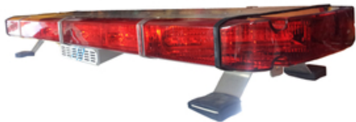
사진 & 도면