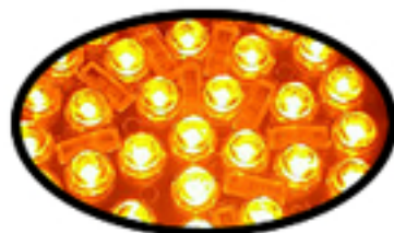
고휘도 LED 특수렌즈와 반사경 모습을 순간 촬영한 사진입니다.