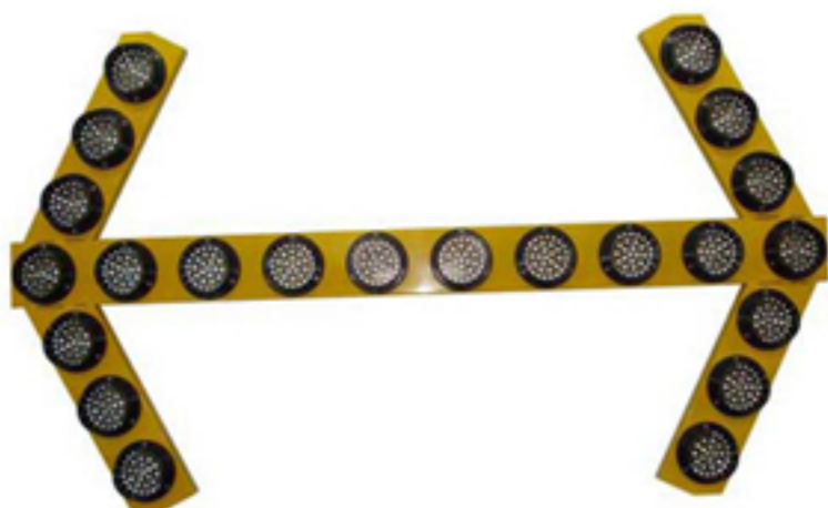
사진 & 도면